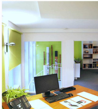
Offene Büroertage - Bad Homburg

gänge und schallabsorbierende Materialien werden Yin genannt. Sie balancieren die Härte eckiger Raumgeometrien oder reflektierenden Stein und Stahl, die als Yang bezeichnet werden.